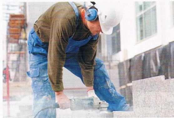
Rys. 26.2. Praca w pyłe