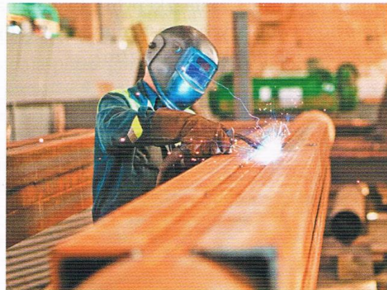
Rys. 26.3. Prace stwarzające zagrożenie pożarem