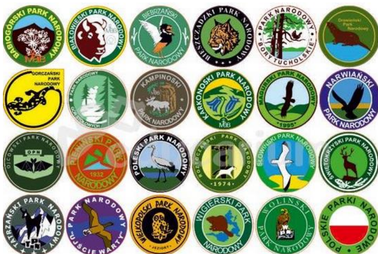
Krkonoský národní park (KRNAP) i Karkonoski Park Narodowy (KPN)

od kwietnia 2013 r. mają jedno wspólne logo. To wyjątkowe i jedyne wśród europejskich parków zdarzenie, podkreśla jedność całych Karkonoszy i długoletnią współpracę obydwu obszarów chronionych. Na logo znajduje się goryczka trójściowa jako typowa roślina KRNAP i dzwonek karkonoski dla KPN.