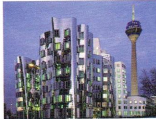
Frank Gehry, budynek w Niemczech