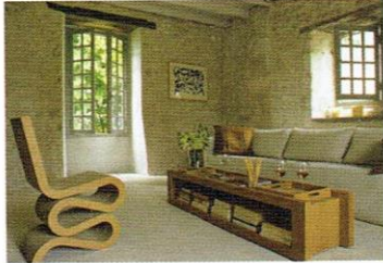
Frank Gehry [gery], dom w Akwitanii