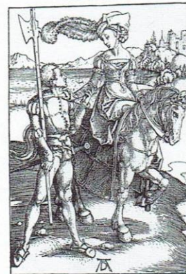
Albrecht Dürer [direr] Dama z giermkciem , 1497